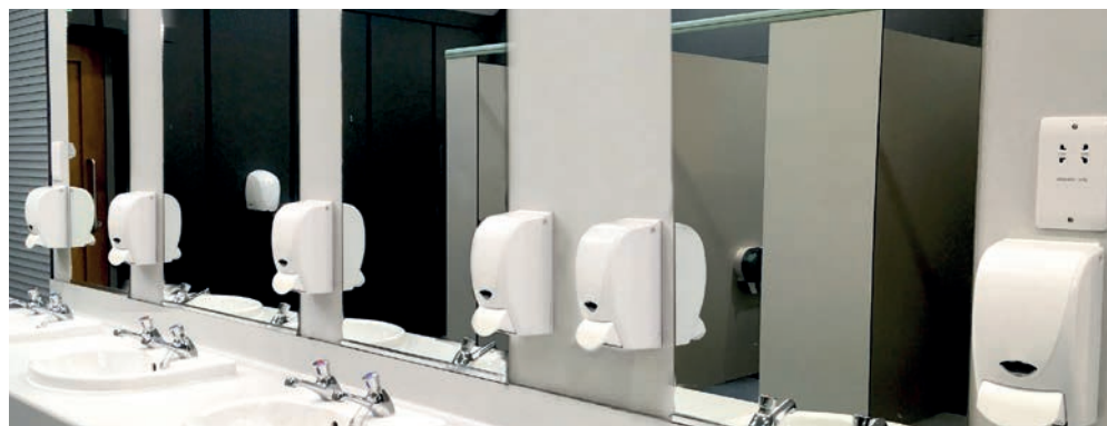
Réf. 6800 PLS >