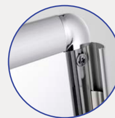
< Réf. 4201 PL